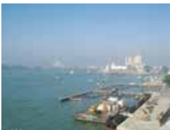
のテラスからの風景