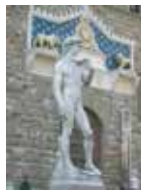
美しい肉体的美のダヴィデ像