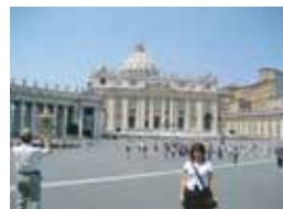
バチカン市国を背景に・・・後ろの白線が国境線です。

構想14年！・・・ついに憧れのイタリアへ行ってきました。（事務所の皆さんアリガトウ）一昨年、皆が上海に慰安旅行へ行ったとき、留守番しておりましたが・・・今度は私の番でしょ～とばかりに行かせてもらいました。7月19日より1週間のツアーで。ヨーロッパの夏は暑いと聞いてましたが、ここまで暑いとは！でも、湿度が低くって日陰は割りに過ごしやすかったです。ジェラートが美味しかったなア～・・・肉が大きかったトカ、ンな事はいいのです。『最後の晚餐』『最後の審判』『天地創造』ナド・・・その場に行かなければ、絶対に見れない壁画もじっくり口を開けて見てきました。何より、バチカン市国に行けた事！1時間以上高い塀の周りをぐるりと並んで荷物検査をして中に入れた時の胸の高まり・・・生えてる草にも感動！嗚呼！願いは叶うんだなア～と心から思いましたよ。そこへんを歩いているイタリア人は皆カッコよくって♥モデルかゴッドファーザーに見えちゃって・・・鏡に映った我姿を眺めつつ・・・ため息。帰国してから3日経つけど、まだ心身ともに抜けないッすねエ～でもまあ・・・しばらくはパスタや肉は見なくてヨシって思ってますけどね。仕事が溜まって中々進みませんが、BLOGに掲載していきますので（写真付で）よろしかったらHP内のBLOGをチェックしてください。【イタリアお上りさん】としてアレコレ書いていきますので、是非、そのノボセ振りをご覧下さいませ。（M）