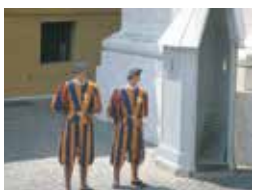
バチカンの憲兵さんはスイス人 ヴェネツィアのホテル・ダニエリ（メチャ顔小さッ）