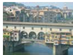
ウフィッツィ美術館から撮ったヴェッキオ橋（おとぎ話の世界デス）